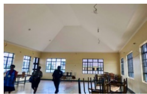
Forventningsfulle elever utenfor matsalen. Innvendig er den ikke ferdig innredet, men takhøyden er god.