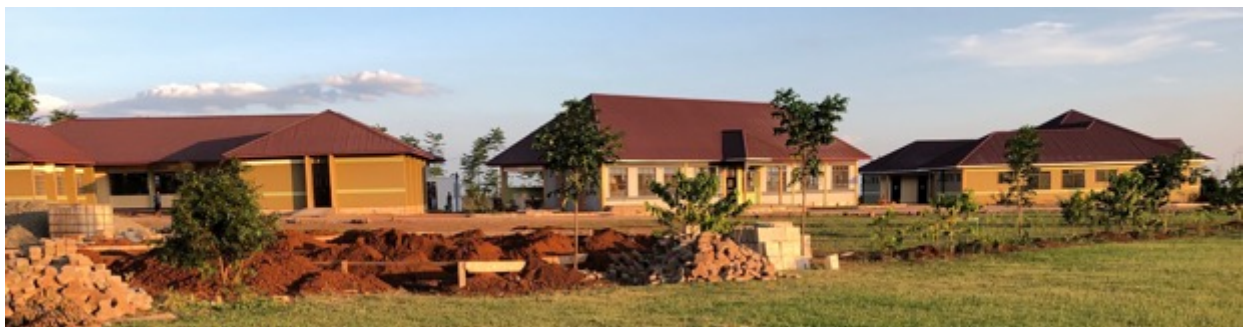
Bakeriet er under bygging og forventes ferdig til nytt skoleår starter i januar 2019.