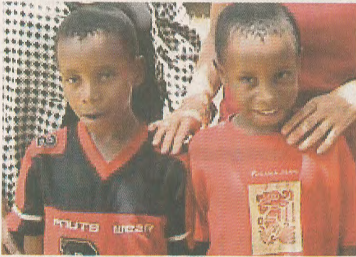
TVILLINGENE: Dotto og Kurwa er nå ti år gamle, og de har fått språk.