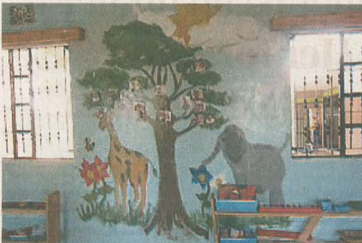
SENTERET: Skolen i Gabriella Centre er fargerik, som kontrast til de grå skolehusene, med tavle og gamle skolebenker som fins i lokalsamfunnene.